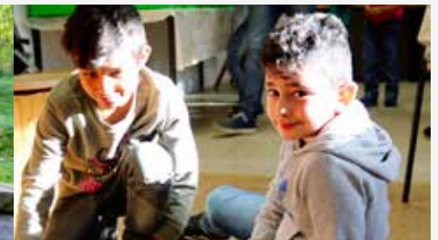
Die Kinder der Felsenmeerschule Hemer und der Gemeinschaftsgrundschule Platte Heide verbrachten eine tolle Zeit in der Arche Noah