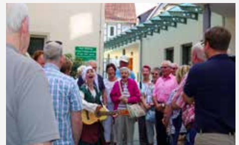
Bei der Stadtführung wurde fleißig mitgesungen

Schon jetzt freuen wir uns auf die Fahrt im nächsten Jahr. Welches Ziel dann angesteuert wird, verraten wir Ihnen in der nächsten Ausgabe der GEWOGE-Mitgliederinformation.