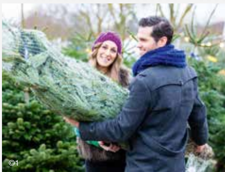
Die GEWOGE macht's möglich: ein stattlicher Baum zum günstigen Preis