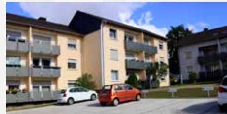
Die Bewohner parken direkt an der Wohnung – ein Service der GEWOGE

Bestand zu errichten und anbieten zu können. Auch rund um unsere beliebten Häuser an der Carl-Schmöle- und Wöhlerstraße haben wir die oft angespannte Parkplatzsituation erfolgreich entschärft. Sehr zur Freude der Bewohner gehört seit dem Spätsommer zu jeder der insgesamt 24 Wohnungen ein fester Stellplatz für das eigene Auto. Der Wohnkomfort wurde so deutlich gesteigert.