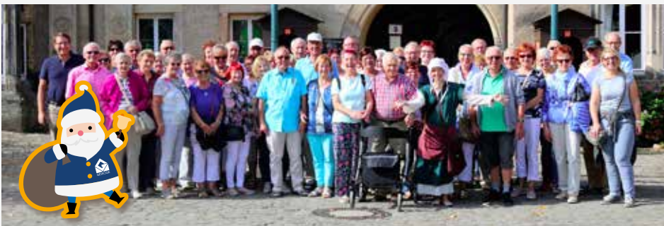
Die ganze GEWOGE-Reisegruppe bei strahlendem Sonnenschein in Detmold

Das Programm der diesjährigen GEWOGE-Tagesfahrt ließ keine Wünsche offen. Bereits früh morgens beim Frühstück im Bistro Bücherwurm herrschte beste Stimmung bei der Reisegruppe. Gut gestärkt ging es für die insgesamt 50 Ausflügler gleich zum ersten Höhepunkt des Tages. Bei blauem Himmel und Sonnenschein präsentierten sich die imposanten Externsteine. Im Anschluss ging die Fahrt nach Detmold, in die größte Stadt im