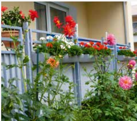
Blumenvielfalt an der Overhuesstraße

Herzlichen Glückwunsch allen Gewinnern! Wir hoffen, dass Sie auch im nächsten Jahr wieder dabei sind und Ihr Haus erblühen lassen.