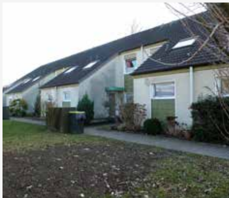
Häuser in der Grevenhofstraße vor und nach den Modernisierungsarbeiten

Uns als Genossenschaft ist es wichtig, jeder Generation das passende Wohnkonzept zu bieten. Extra für Familien mit Kindern wurde in den 80er Jahren eine Reihenhaussiedlung im Mendener Stadtteil Böisperde errichtet. Die Häuser verfügen alle über eigene Gärten, viel Platz für die ganze Familie und gut aufgeteilte Grundrisse.