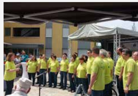
Auftritt von amante della musica auf den Feierlichkeiten der GEWOGÉ am 9. Juli 2017