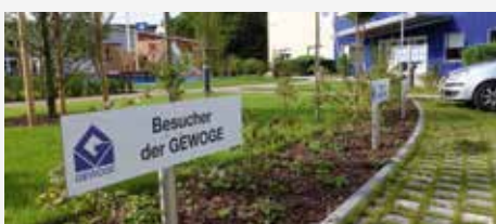
GEWOGE-Geschäftsstelle: Parken ist jetzt direkt vor der Tür möglich