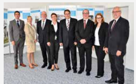
Die Mitglieder des Vorstandes und Aufsichtsrates der GEWOGE in aktueller Besetzung

Nehmen Sie den Termin zum Anlass, sich über Neuigkeiten zu informieren, lernen Sie die Mitglieder des Vorstandes und Aufsichtsrates sowie das Team der GEWOGE persönlich kennen. Wir freuen uns auf ein volles Haus zur Mitgliederversammlung und Ihre Teilnahme.