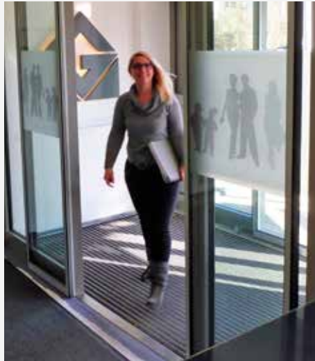
Besucher erreichen unsere Zentrale jetzt barrierefrei

Es ist nicht von der Hand zu weisen: In den letzten Monaten hat sich viel getan im und um das GEWOG -Verwaltungsgebäude in Lendringsen. Nachdem zuerst der Wartebereich komplett erneuert wurde, erfolgte die Umgestaltung der GEWOG -Teilfläche des Lendingser Platzes. Passend zu diesem neuen und modernen Erscheinungsbild präsentiert sich seit Anfang 2018 auch der Eingangsbereich unseres Verwaltungsgebäudes. Unsere neue Eingangstür ist nicht nur ein optisches Highlight, sondern auch komfortabel und praktisch. Im Zuge der Modernisierung haben wir Wert darauf gelegt, die Technik den Bedürfnissen auch für Menschen anzupassen, die auf einen Rollstuhl oder eine Gehhilfe angewiesen sind. Die Tür öffnet sich automatisch und erleichtert ebenso Familien mit Kinderwagen sowie voll bepackten Handwerkern den Zutritt zu unserem Verwaltungsgebäude.