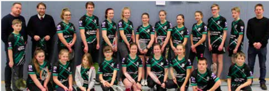
Die Mädchen und Jungen, Betreuer und Sponsoren sind begeistert von den neuen Trikots

Mit der mendenCROWD haben die Stadtwerke Menden eine tolle Aktion ins Leben gerufen. Mendener Vereine aus allen Bereichen haben hier die Möglichkeit, Projekte vorzustellen und diese durch die Unterstützung vieler Menschen und Unternehmen zu finanzieren. Der große Zuspruch zeigt, wie stark die Mendener als Gemeinschaft zusammenhalten.