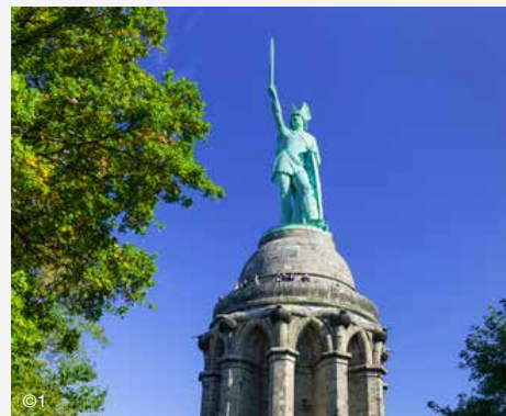
Hermannsdenkmal in Detmold

Melden Sie sich schnell an! Die Erfahrung zeigt, dass die Plätze heiß begehrt sind. Yvonne Wolgast freut sich unter 02373/9890-20 auf Ihre Anmeldung zu einem Preis von nur 56 Euro pro Person.