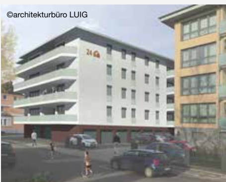
Visualisierung des neuen GEWOG -Gebäudes in der Papehausenstraße

Im Stadtzentrum von Menden errichtet die GEWOG ein weiteres modernes Wohnhaus mit Tief- und Einzelgaragen. Voraussichtlich ab April entstehen auf dem bislang als Parkplatz genutztem Grundstück 12 Mietwohnungen in