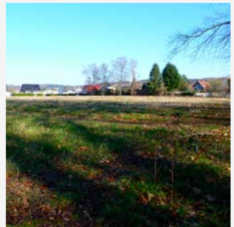
Attraktives Bauland in zentraler Lage von Lendringsen

Bereits in den ersten Tagen nach Bekanntmachung des Grundstückskaufs zeigte sich, dass das Interesse an der Anmietung einer Wohnung oder aber am Kauf eines Einfamilienhauses mit schönem Grundstück groß ist. Bis allerdings die ersten Bewohner in ihre Wohnungen bzw. Häuser einziehen können, wird noch Zeit ins Land ziehen. Die Stadt Menden wird für die Erschließung des Grundstücks aufgrund der Komplexität vor Ort und der Größe voraussichtlich bis zu zwei Jahre benötigen. Dennoch beantwortet Ihnen unsere zuständige Mitarbeiterin Yvonne Wolgast unter 02373/9890-20 gerne Ihre Fragen und informiert Sie über die ersten Details zum Projekt.