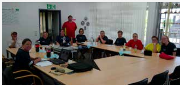
Durch die GEWOG E-Möbelspende findet Jedermann einen Sitzplatz

In diesem Jahr konnten wir mit einer Möbelspende der Ortsgruppe Menden e.V. der DLRG eine große Freude machen. Durch die Ausstattung der Räumlichkeiten mit den entsprechenden Tischen und Stühlen können jetzt neben den Theoriestunden der Rettungsschwimmkurse auch Jugendbesprechungen und Vorstandssitzungen dort stattfinden.