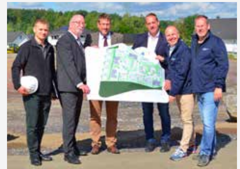
Vertreter von der GEWOGE und von den Stadtwerken Menden bei einem gemeinsamen Termin vor Ort

Gleich in vielfacher Hinsicht wird die Versorgung mit Strom und Wärme im neuen Wohnquartier effizient gestaltet. Eine Kombination aus lokalem Blockheizkraftwerk und Photovoltaik wird bis zur Hälfte die benötigte Energie direkt vor Ort erzeugen und bereitstellen. Das erdgasbetriebene BHKW erzeugt zudem Nahwärme zum Heizen und unterstützt die Warmwasser-Aufbereitung in den einzelnen Wohngebäuden. Weiterhin ist zudem geplant, Ladepunkte für E-Autos am Wohngebiet zu installieren.