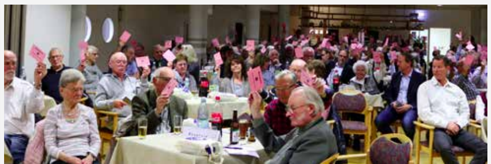
Rege Beteiligung bei einer der Abstimmungen

Wenn Sie sich detailliert über das GEWOG -Geschäftsjahr 2018 informieren möchten, bieten wir Ihnen den aktuellen Geschäftskurzbericht 2018 auf unserer Homepage unter www.gewoge-menden.de als Download an.