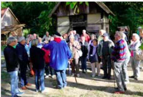
Im Freilichtmuseum Münster gab der Kiepenkerl so manch Anekdote zum Besten

Die schon traditionelle Tagesfahrt der GEWOGGE-Mitglieder führte die Reisegruppe im September 2019 ins malerische Münsterland. Nach einem gemeinsamen Frühstück im GEWOGGE-Mitgliederforum freuten sich alle auf die Programmpunkte des Tages. Die erste Etappe führte zum Schloss Nordkirchen und die einstündige Fahrt verging wie im Fluge. Der barocke Bau begeisterte mit seinen phantastischen Außenanlagen und den imposanten Innenräumen. Weiter ging es zum Hof Grothues-Potthoff, wo ein schmackhaftes Mittagessen serviert wurde.