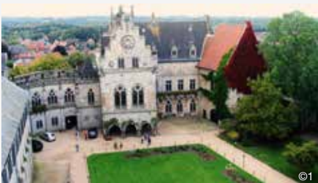
Burg Bad Bentheim

Jetzt schnell anmelden! Noch gibt es einige freie Plätze für unsere Tagesfahrt „Burgen-Blüten-Brauereien“ am 14. September zu einem Preis in Höhe von 58,00 EUR p. P. inklusive Verpflegung.