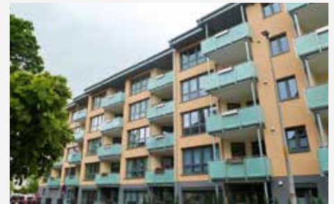
Hell, zentral, komfortabel: Unsere Neubauwohnungen in der Papenhausenstraße

Kürze beabsichtigen wir, Ihnen ein weiteres Neubauvorhaben vorzustellen.