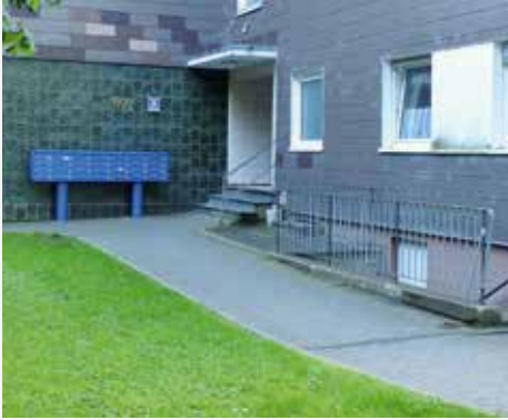
Der Eingangsbereich in der Overhuesstraße vor, während und nach der Sanierung

Die Veränderungen an den Objekten sind nicht nur optisch sehr gelungen; die nun barrierefreien Eingänge machen es besonders unseren älteren Mitgliedern und Familien mit Kindern viel leichter, die Wohnungen zu erreichen.