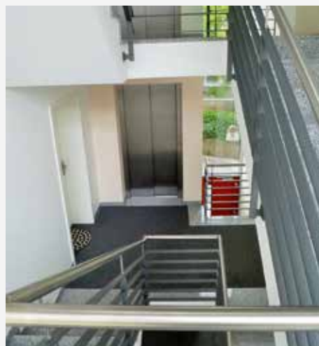
Vorbildliches Treppenhaus der Hausgemeinschaft Walburgisstraße

Ein ordentliches Treppenhaus ist Aushängeschild für eine intakte Hausgemeinschaft und vor allem ist es der Flucht- und Rettungsweg des Hauses. In der Hausordnung ist geregelt, dass grundsätzlich keine Gegenstände (z. B. Schränke, Schuhe, Pflanzen, Schirmständer etc.) in den Treppenhäusern und Fluren abgestellt werden dürfen. Ausnahmen gibt es für Kinderwagen, Gehhilfen oder Ähnliches, sofern diese die Fluchtwege nicht blockieren.