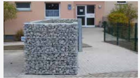
Neue Hauszuwegung in der Hunsrückstraße