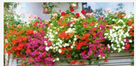
Prämierter Balkon aus dem Jahr 2014 in Lendringens

Auf der letzten Seite finden Sie den Anmeldecoupon. Bitte reichen Sie diesen ausgefüllt bis zum 17. Juli 2015 bei uns ein.