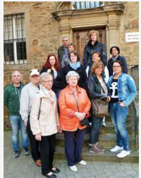
Teilnehmer der Stadtführung im April 2015

Interessierte können sich bei Yvonne Robbers unter Telefon 02373 9890-20 oder robbers@gewoge-menden.de anmelden.