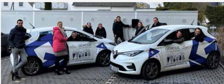
Die GEWOGE-Mitarbeiter nutzen die E-Fahrzeuge für Außendienstfahrten gerne und nehmen das Angebot wunderbar an