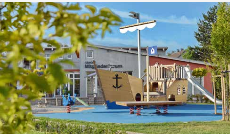
Der GEWOGE-Wasserspielplatz in Lendringsern lässt Kinderherzen höher schlagen

Um nicht nur den kleinen Besuchern größten Spaß, sondern auch den Erwachsenen Freude zu bereiten, lädt der schöne Außenbereich des Bistro Bücherwurm dazu ein, ein kühles Getränk, Kaffee und Kuchen oder ein Eis zu genießen. Schon bald werden die Tage länger, die Luft wärmer und das Kinderlachen auf unserem Spielplatz lauter. Wir freuen uns darauf!