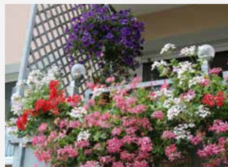
Üppige Blütenpracht im Sommer 2019 auf einem Balkon in Menden-Obsthof

Allen Teilnehmerinnen und Teilnehmern wünschen wir viel Erfolg und ein besonders gutes Händchen mit den Pflanzen.