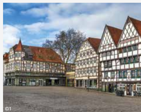
Das schöne Städtchen Soest hat viel zu bieten

Gerne gibt Ihnen Yvonne Wolgast nähere Informationen und nimmt Ihre Anmeldung zum Preis von € 55,00 pro Person unter 02373/9890-20 entgegen.