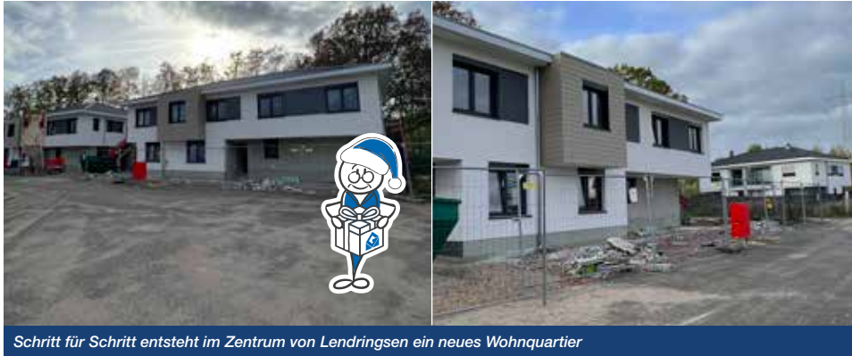
Schritt für Schritt entsteht im Zentrum von Lendringesen ein neues Wohnquartier

Die 4-Parteien-Häuser auf der ehemaligen Max-Becker-Kampfbahn in Lendringesen nehmen mehr und mehr Gestalt an. Mit zunehmendem Baufortschritt wird deutlich, dass sich die zukünftigen Bewohner auf moderne und ansprechende Häuser und Wohnungen freuen können.