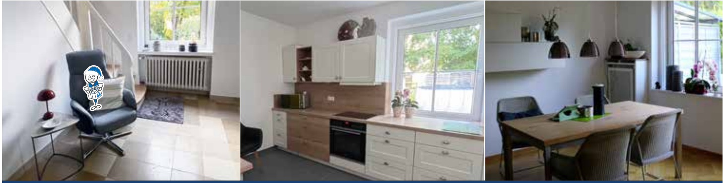
Modern, gemütlich und ansprechend präsentiert sich das Doppelhaus nach der Modernisierung

Im Zentrum von Lendringsen, in unmittelbarer Nähe zum GEWOGESeniorenzentrum, schlummerte ein Doppelhäuschen lange im Dornröschenschlaf. Durch den Start von Modernisierungsarbeiten wurde dieser tiefe Schlaf endlich beendet. Sehr zur Freude der jetzigen Bewohner, denn aus dem unschein-