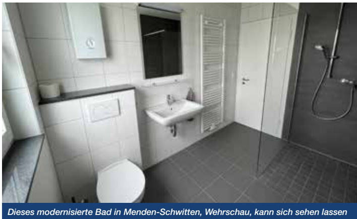
Dieses modernisierte Bad in Menden-Schwitten, Wehrschau, kann sich sehen lassen

Moderne Badezimmer mit ebenerdigen Duschen sind in unseren Neubauten gang und gäbe. Da die Ansprüche an zeitgemäßes Wohnen ständig steigen, ist es uns wichtig, den Wohnkomfort auch in unseren Bestandswohnungen weiter sukzessive zu erhöhen. Dort wo es möglich ist, gehen wir seit Jahren immer mehr dazu über, die alten Bäder barrierefrei und modern umzubauen.