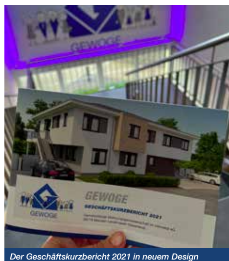
Der Geschäftskurzbericht 2021 in neuem Design

Durch eine gut durchdachte Modernisierung kann sich ein altes Badezimmer in eine Wohlfühlzone verwandeln. Gemeinsam mit den ausführenden Handwerksbetrieben geht es uns vor allem darum, durch gute Planungen das Beste aus vorhandenen Strukturen herauszuholen, qualitativ gute Materialien zu verbauen und moderne Trends einfließen zu lassen, um so den Erholungsfaktor und gleichzeitig den Komfort zu steigern. Natürlich sind solche Modernisierungsmaßnahmen leider sehr kostenintensiv und müssen anteilig auf die Miete umgelegt werden.