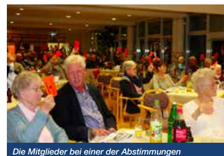
Die Mitglieder bei einer der Abstimmungen