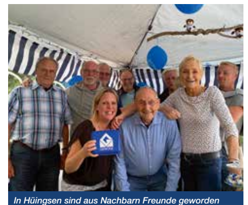
In Hüingsen sind aus Nachbarn Freunde geworden