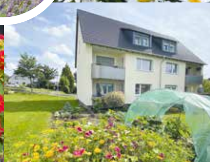
Blüten in allen Farben schmücken die Balkone und Gärten der GEWOGÉ-Mitglieder