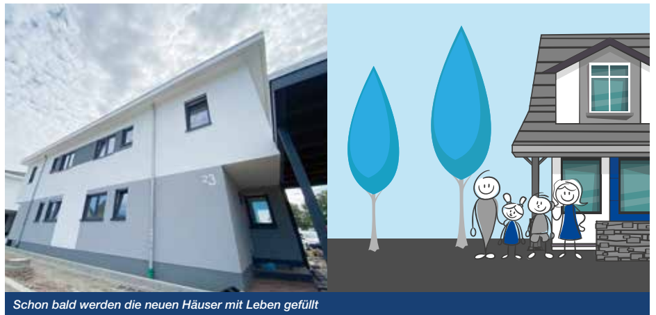
Schon bald werden die neuen Häuser mit Leben gefüllt

Wer in letzter Zeit durch die Josef-Winckler-Straße gefahren oder gegangen ist, dem ist sicherlich aufgefallen, dass die Bauarbeiten der Doppelhaushälften bereits weit fortgeschritten sind. Mittlerweile konnten auch einige Eigentümer ihre Schlüssel entgegennehmen und ihr Eigenheim beziehen. Auch die Gestaltungsarbeiten der Vorgärten sind in vollem Gange und runden schon bald das Bild der modernen Immobilien ab. Wir planen, schon bald mit der Bebauung des restlichen Grundstücks am alten Sportplatz in Lendringsen zu starten