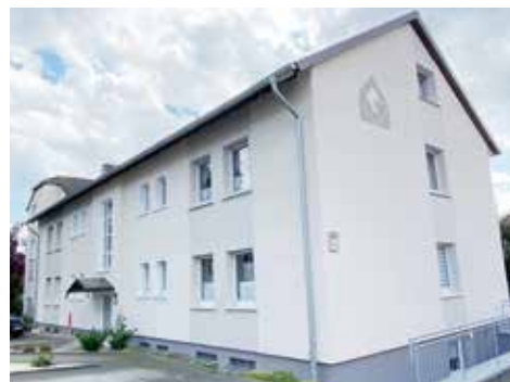
Attraktive Wohnlage trifft auf attraktive Fassadenfarbe

An dieser Stelle gilt unser Dank dem Team des Veranstalters, den Künstlern sowie den weiteren Sponsoren, die es ermöglicht haben, dass die Besucher des Zeltedachfestivals eine unbeschwertere und sichere Zeit erleben durften.