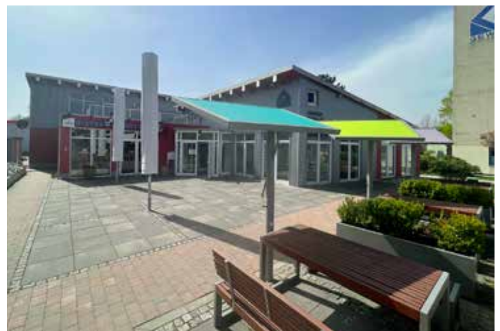
Das Café-Bistro liegt direkt neben dem schönen GEWOGEWasserspielplatz in Menden-Lendringsen

Bei Interesse an weiteren Informationen und dem vollständigen Exposé wenden Sie sich bitte mit einer persönlichen Nachricht an Markus Wessel ( mail@markuswessel.com )