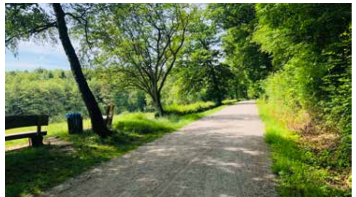
Eines der vielen Projekte, an der sich der Förderverein beteiligte, ist der Rolliweg in der Mendener Waldemei

Eine aussagekräftige Beschreibung Ihres gemeinnützigen Vorhabens, die gleichzeitig als Bewerbung dienen soll, nimmt Yvonne Wolgast gerne per E-Mail ( wolgast@gewoge-menden.de ) entgegen.