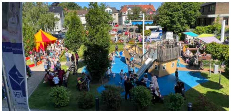
Gute Laune herrschte beim diesjährigen GEWOG -Kindersommerfest in Lendringsen

Es ist so schön zu sehen, dass unser Alltag immer mehr wieder seinen normalen Gang geht und durch Veranstaltungen wie diese wieder bunter und fröhlicher wird.