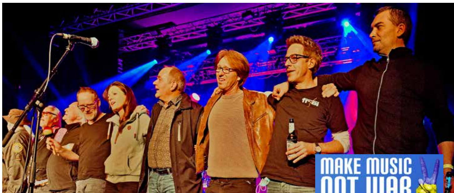
Gemeinsam für den guten Zweck auf der Bühne der Wilhelmshöhe: Die Künstler*innen begeisterten das Publikum

Bereits am 8. April fand auf der Wilhelmshöhe in Menden ein Benefizkonzert statt mit dem Ziel, durch den Erlös Menschen zu unterstützen, die unter dem Krieg in der Ukraine leiden. Die Mendener Veranstaltungsfirma phono-forum übernahm die Organisation und schnell fanden sich etliche Sponsoren sowie Musikerinnen und Musiker, die gemeinsam ein Zeichen für Frieden setzen wollten. Der Erlös des Konzertes wurde an die Ukraine Soforthilfe sowie an den Verein Mendener in Not gespendet, so dass den unmittelbar Betroffenen geholfen werden kann. Wir sind froh und stolz, dass auch wir als GEWOGÉ durch einen Geldbetrag zum Erfolg des Benefizkonzerts beitragen konnten.