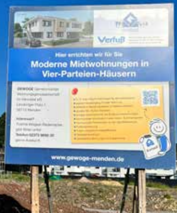
Der Baufortschritt der Häuser schreitet sichtlich voran