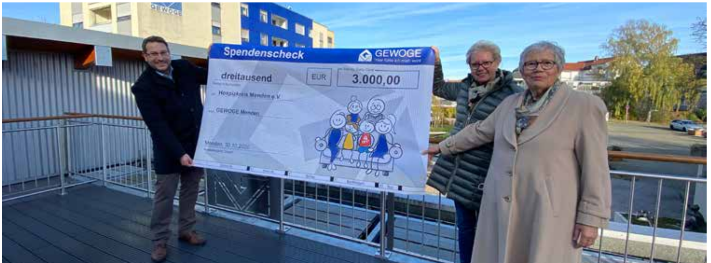
Die ehrenamtlichen Mitarbeiter des Hospizkreises Menden erfahren in der Vergangenheit finanzielle Unterstützung

Seit mehr als zwei Jahrzehnten engagiert sich unser Förderverein regelmäßig für soziale, kulturelle und integrative Projekte in unserer Stadt. So wurden beispielsweise in den letzten Jahren sämtliche Mendener Kindergärten mit neuem Spielzeug ausgestattet, das Bürgerbad Leitmecke bei der Anschaffung neuer Wasserspielgeräte, die Realisierung des Rolliweges in der Waldemei finanziell und der Hospizkreis Menden e.V. bei der Aus- und Weiterbildung ehrenamtlicher Helfer unterstützt.